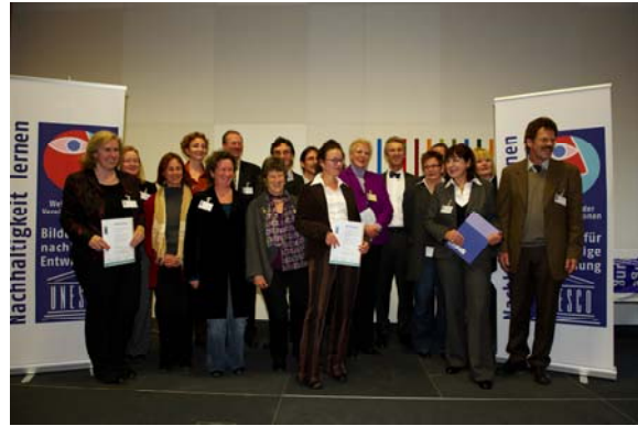
Eindrücke der Preisverleihung „Offizielle UN-Dekade-Projekte“ (links: Kampagne „WertvollerLeben“, rechts: Einige Partner des Qualitätssiegels „Umweltbildung.Bayern“)

Insgesamt wurden 91 Initiativen aus ganz Deutschland als offizielle Dekade-Projekte ausgezeichnet. Die Auszeichnung erhalten Aktionen, die die Anliegen der Dekade vorbildlich umsetzen: Sie vermitteln Kindern und Erwachsenen nachhaltiges Denken und Handeln. 38 der in München ausgezeichneten Initiativen arbeiten in Bayern. Das Nationalkomitee hat bereits mehr als 970 Initiativen als Dekade-Projekte ausgezeichnet. Anlass der Preisverleihung war das Treffen des Runden Tisches der UN-Dekade, das diesmal auf Einladung der Bayerischen Staatsregierung in München stattfand.