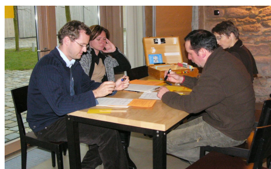
Gemeinsames Arbeiten in Kleingruppen