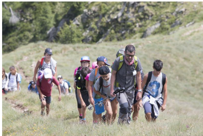
Jugend auf dem Gipfel 2017

Technische Partnerschaften mit anderen Netzwerken oder Organisationen, die auf nationaler/regionaler Ebene in anderen Alpenländern tätig sind, sind ebenfalls möglich. ALPARC steht neuen Partnerschaften in den verschiedenen Alpenländern aufgeschlossen gegenüber.