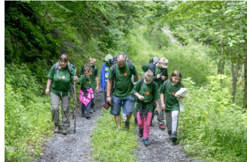
Jugend auf dem Gipfel 2017