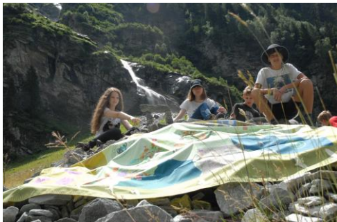
Jugend auf dem Gipfel 2017 Nationalpark Hohe Tauern Kärnten