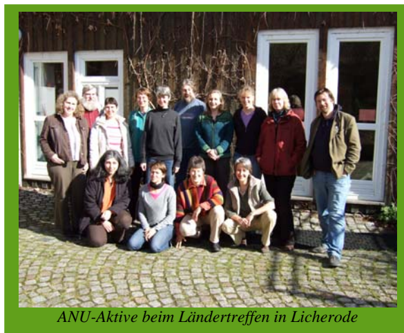
ANU-Aktive beim Ländertreffen in Licherode